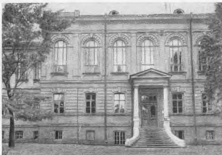
Сабурова дача. Здание пансионата для душевнобольных в Харьковской психиатрической больнице. Конспиративная квартира Артема.