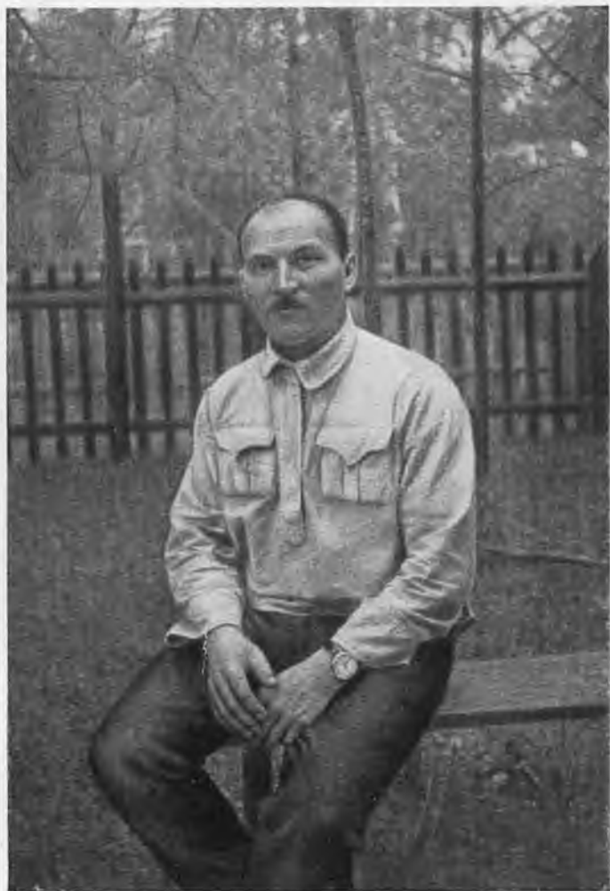
Артем. 1919 г.