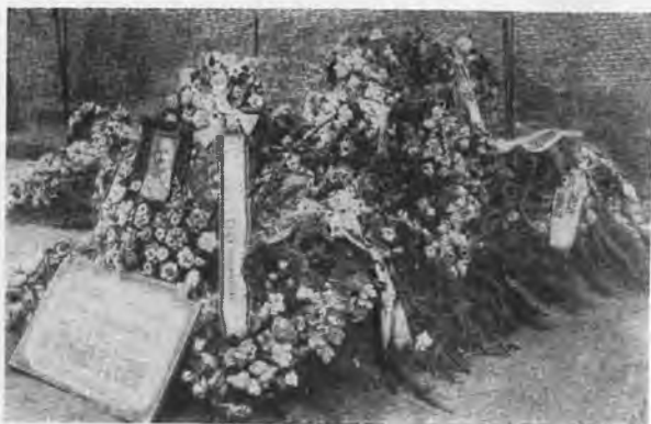
Могила Артема у Кремлевской стены.