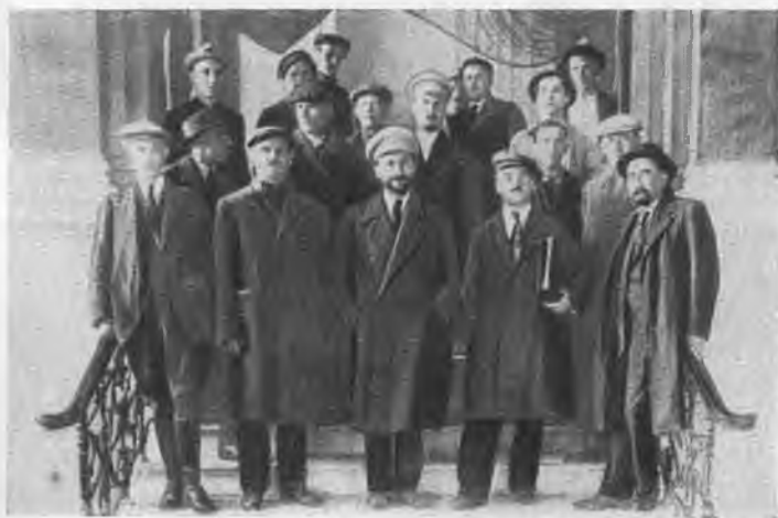
Артем во главе делегации советских профсоюзов перед поездкой в Западную Европу. 1920 г.