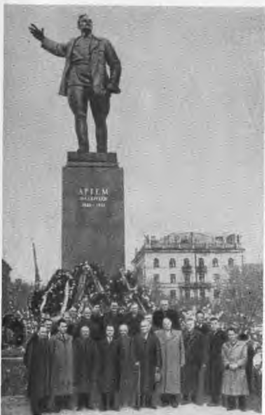
Открытие памятника Артему в городе Артемовске, 1959 г.